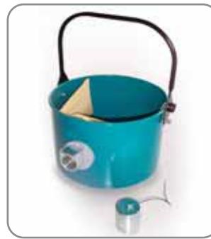
Kit optionnel avec embouchure, sac papier (10 pièces) et obturateur (code 560327)

Un bac spécifique intégrant l'embouchure, le sac papier de récupération et l'obturateur d'embouchure, est également disponible.